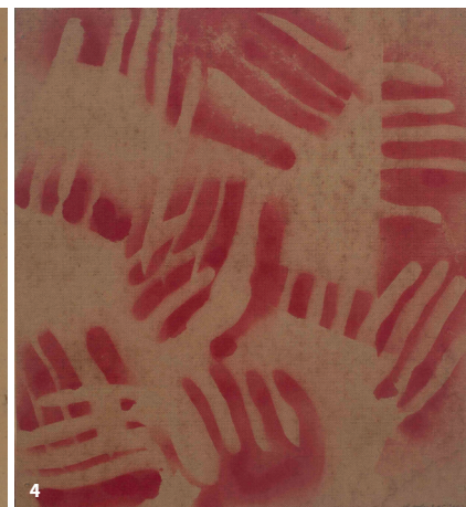
Cover Adolf Frohner, Jackie , 1968, © Sammlung Christian Ettl, Foto: Christian Redtenbacher; Oswald Oberhuber, Figur , 1954, © Sammlung Stephan Ettl, Foto: Konrad Strutz