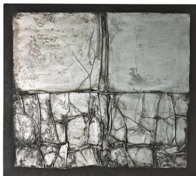
Christo, Surface d'emballage , 1961