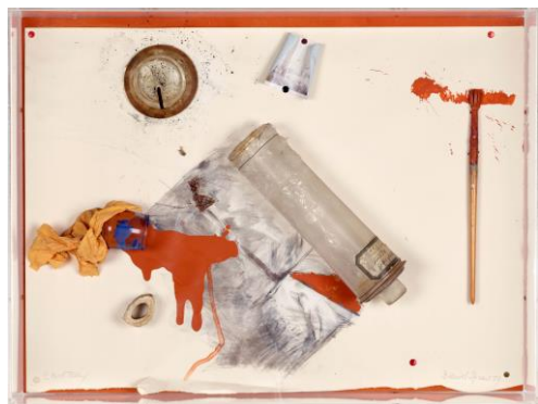
Daniel Spoerri, Où est la vipère - Une page d'histoire , 1974

Kuratorinnen: Susanne Neuburger, Elisabeth Voggeneder